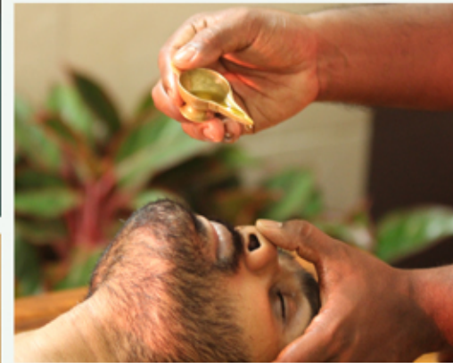
ناسيا إجراء بانجاكارما الذي يتم فيه إعطاء الدواء الموصوف من خلال فتحة الأنف